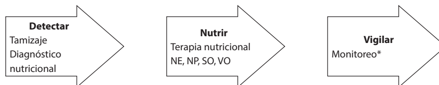
Figura 1. Etapas del cuidado nutricional según el Principio # 2 de la Declaración de Cartagena. NE: nutrición enteral; NP: nutrición parenteral; SO: suplementos orales; VO: vía oral. *Monitoreo y seguimiento del plan nutricional intrahospitalario y plan de egreso hospitalario con manejo nutricional, que incluye la educación nutricional para el paciente, cuidador y familia.

El tamizaje nutricional busca identificar los pacientes desnutridos o en riesgo de desnutrición. Las herramientas de tamizaje validadas permiten identificar los