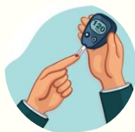
Insumos para tomar glucometría