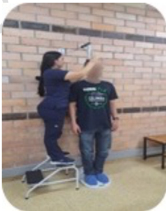
1B. Tallímetro SECA (Lab)