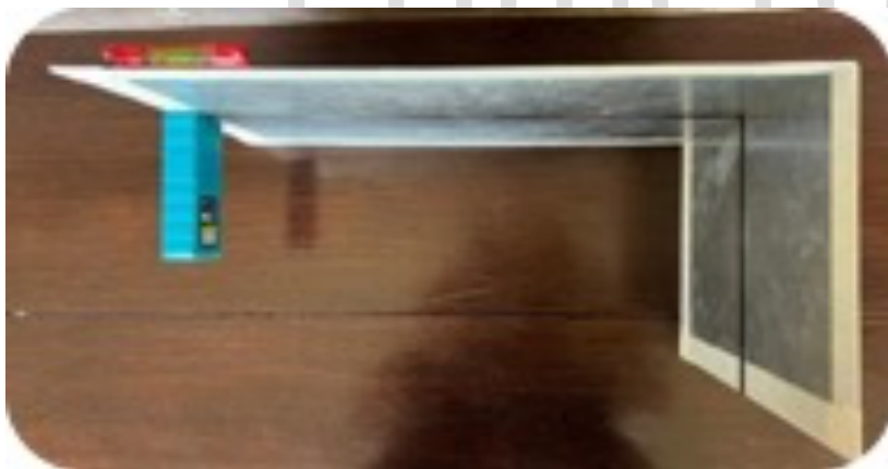
2D. Pieza diseñada en aluminio para el uso del medidor láser