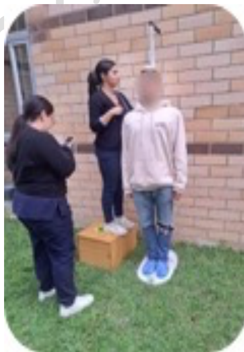
1C. Tallímetro SECA (Campo)