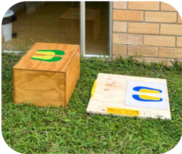
2A. Tabla para pararse en campo abierto