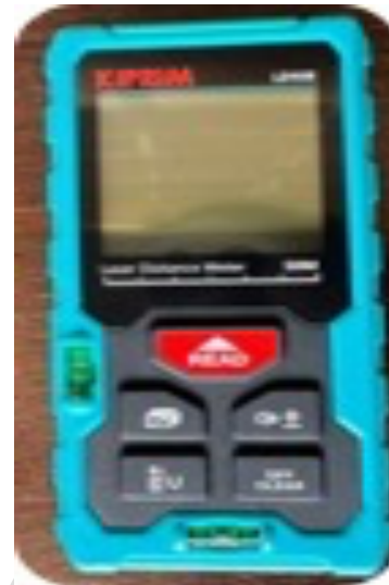
2B. Medidor láser (Kiprim LD50E)