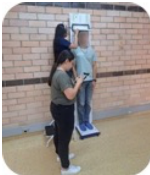
1A. Tallímetro de madera (Lab)