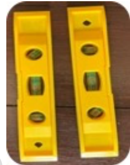
2C. Niveles para medidor