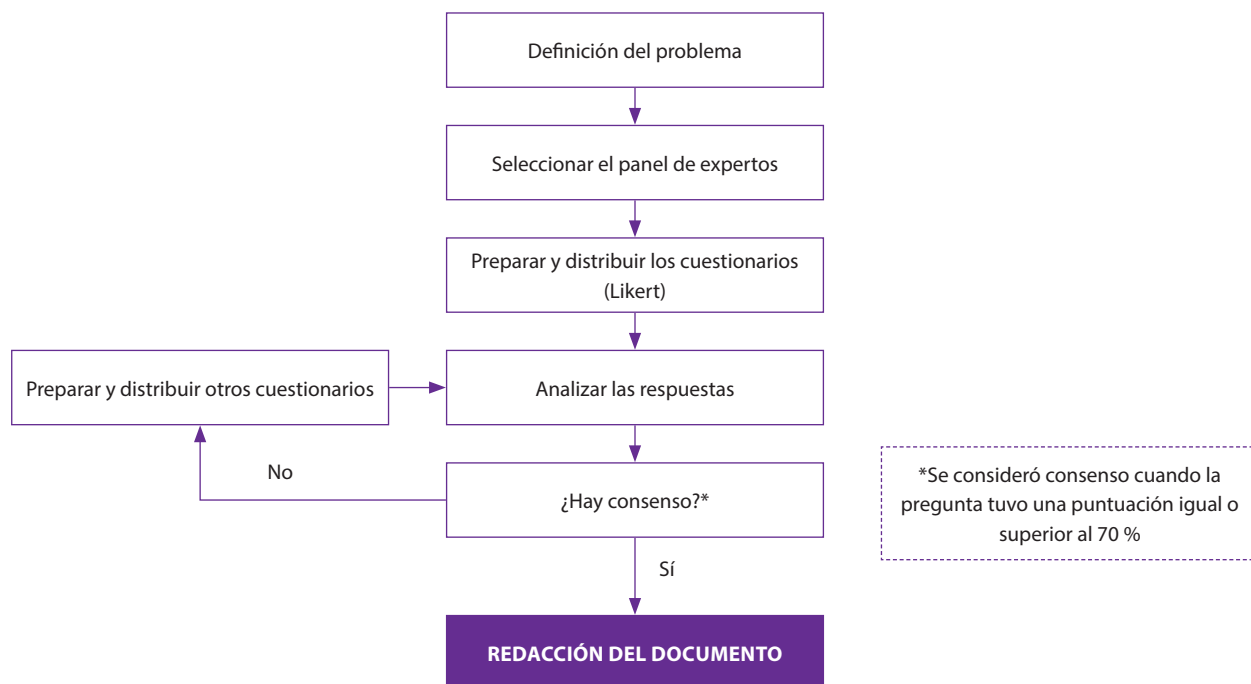
Figura 1. Método Delphi utilizado en el consenso.