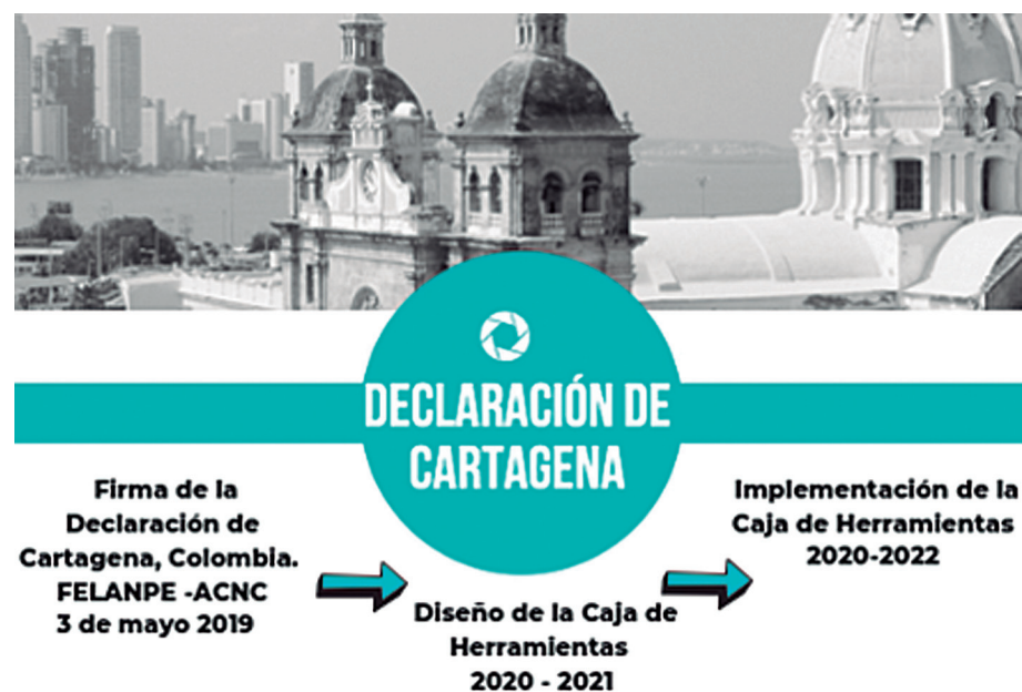
Figura 1. Etapas de la Declaración de Cartagena.

Después de la firma de la Declaración de Cartagena se conformaron grupos de trabajo para la creación de la caja de herramientas que busca facilitar la implementación de la Declaración (Figura 1). El comité de difusión publica el 13 de cada mes información sobre un principio de la Declaración (Figuras 2 y 3).